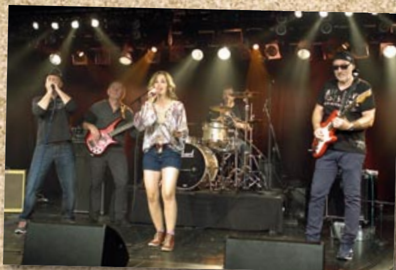
Foolhouse Blues Band, am 08.02.2020 zu Gast im Maximal.

Sa. 29. Feb. 2020, 20.00 Uhr, AZ Rödermark, Kelterscheune, Darmstädterstr. 18, Urberach. VVK 20,80 €, AK 21 €, erm. 18 €, Sozialkarten 10,50 €