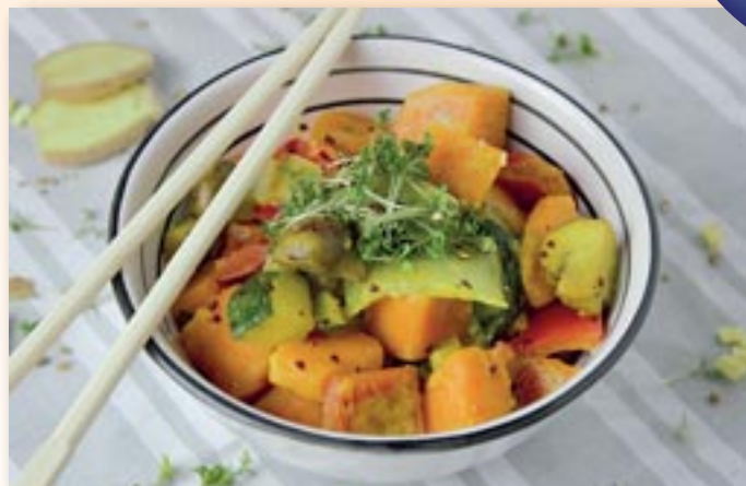
Am Beginn einer Ernährungsumstellung ist es sinnvoll, zunächst leicht verdauliche Rezepte zu kochen.

Reizdarmsyndrom sehr individuell ist und es leider noch keine Standardbehandlung gibt, die allen Betroffenen hilft.« Als Basistherapie zur unterstützenden Behandlung bei Reizdarm, besonders wenn dieser mit Durchfällen, leichten Krämpfen und Blähungen einhergeht, hat sich seit mehr als 50 Jahren ein pflanzliches Myrrhe-Kombinationsarzneimittel aus der Apotheke bewährt.