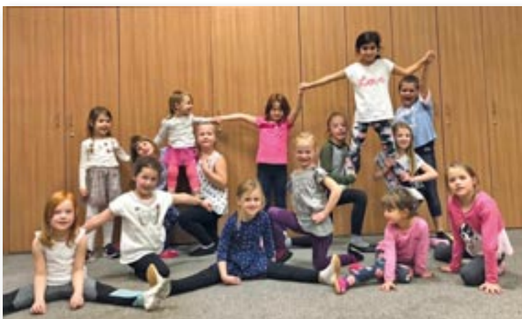
Die Lollipops freuen sich auf ihren Auftritt bei der Knallkepp-Kindersitzung »Happy Konfetti«.