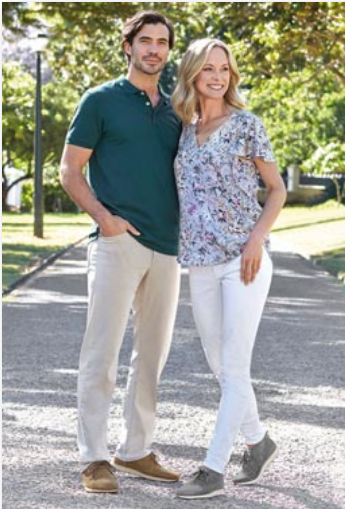
Handschuhweiches Veloursleder macht die Mokassins besonders bequem.

Zwar geht 2020 nichts ohne die Farbe Weiß, vor allem beim Evergreen Sneakers. Doch die Auswahl an farbigen Schuhen scheint so groß wie nie zuvor. Zu den Trendfarben gehören Scharlachrot, Safrangelb, Orange, ein cooles Biskaya-Grün und Blau in allen Tönen. Daneben spielen softe Töne wie helles Grau, Creme oder Caramel eine große Rolle. Bei den Mustern behalten Animal Prints ihre Stellung, gestreift bleibt angesagt und Punkte kommen hinzu. Modebewusstsein muss zudem lange nicht mehr auf Kosten des Komforts gehen. Flache Schnürschuhe beispielsweise können heute zu fast jedem Outfit getragen werden. Besonders bequem sind Schuhe, die dem gesunden Barfußgehen so nahe wie möglich kommen. Eine natürliche Schuhform wie bei den Modellen von ComfortSchuh bietet einen breiten Zehenbereich. So haben die Zehen Platz, um sich beim Abrollen zu krümmen,